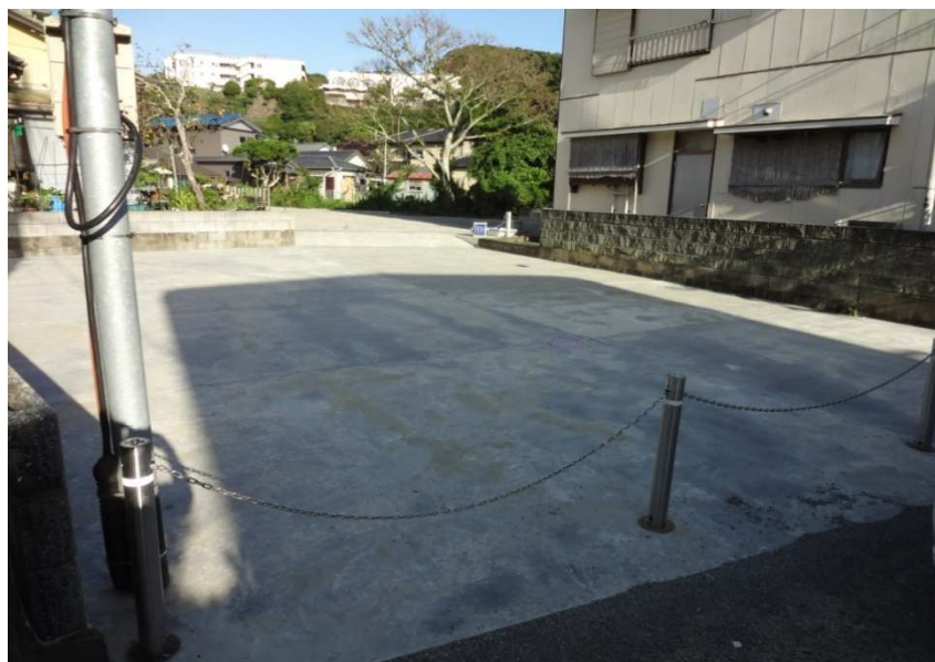
南西側より北東方向に撮影